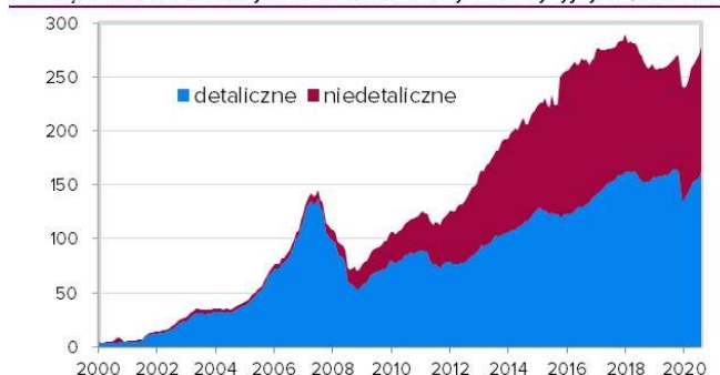
Miesięczna wartość aktywów netto funduszy inwestycyjnych (mld PLN)